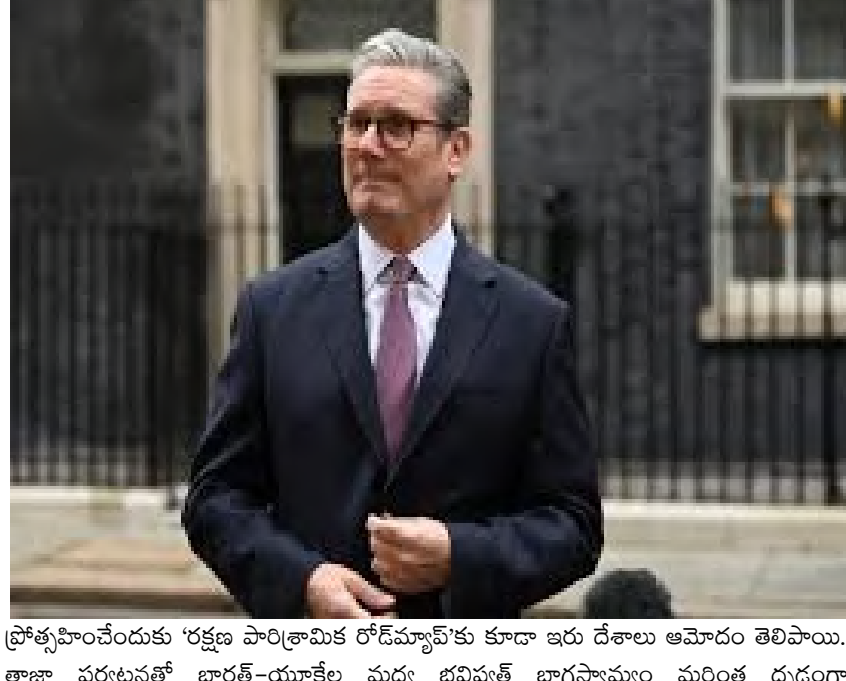
ప్రోత్సహించేందుకు 'రక్షణ పారిశ్రామిక రోడ్ మ్యాప్' కు కూడా ఇరు దేశాలు ఆమోదం తెలిపాయి. తాజా పర్యటనతో భారత్-యూకేల మధ్య భవిష్యత్ భాగస్వామ్యం మరింత దృఢంగా మారుతుందని విదేశాంగ శాఖ విశ్వాసం వ్యక్తం చేసింది.